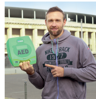
Unser Schirmherr Robert Harting – Olympiasieger im Diskuswerfen.