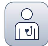
BIOTRONIK Patient App

2 Download der BIOTRONIK Patient App Wechseln Sie auf Ihrem Smartphone (Android™ 8.1 oder neuer, iOS 12 oder neuer) zum App Store® oder zum Google Play™ Store. Die App wird kostenfrei bereitgestellt. (Hinweis: Auf Tablets kann die App nicht genutzt werden.)